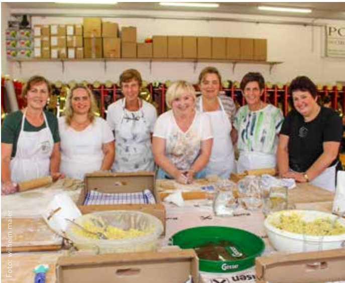
Die Bruckhäusler Bäuerinnen kamen mit dem Brodakropfen backen nahezu nicht nach.