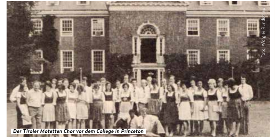
Der Tiroler Motetten Chor vor dem College in Princeton