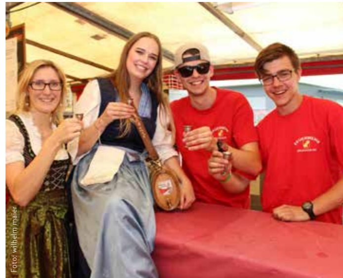
Treffpunkt einmal mehr die Weinbar.